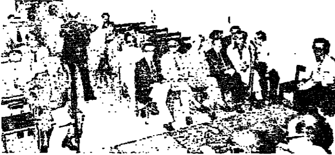
مشهد علم النواب قبل اكتمال التصويت